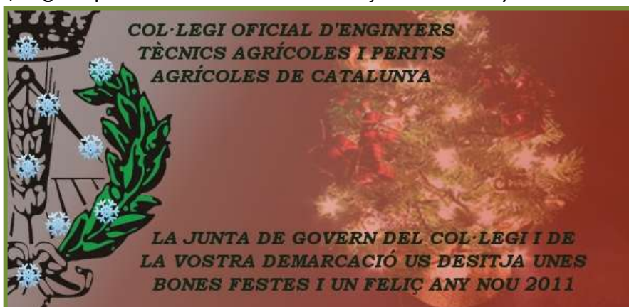
Postal felicitació Nadal 2010

El Col·legi juntament amb les demarcacions va fer, com es tradició, la felicitació de Nadal per a tots els col·legiats. Esperem que tal i com deia la postal, hagueu passat un bon Nadal i una felix entrada d'any nou.