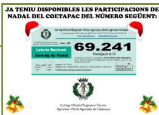
Cartell amb mostra participacions

Tot i que la decisió de fer les participacions es va prendre a falta d'un mes del sorteig aproximadament i el marge de temps era curt, s'han venut un total de 672 participacions, així que de cara a aquest any 2011 i veient l'èxit que han tingut intentarem organitzar-ho amb més temps per a que ningú es quedi sense.