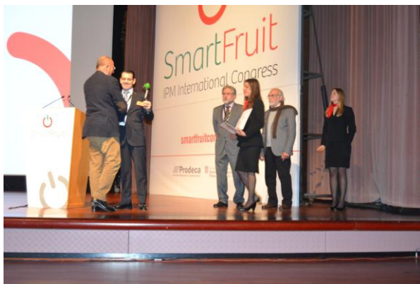
Un moment del lliurament dels premis de l'any passat

El fet que Catalunya sigui un veritable pool agroalimentari de primera magnitud a nivell europeu i una de les principals zones productores de fruita del continent fa que aquest bon nivell esdevingui una veritable necessitat i acabi essent a la vegada un exemple de la projecció internacional que en el sector hortofructícola té Catalunya.