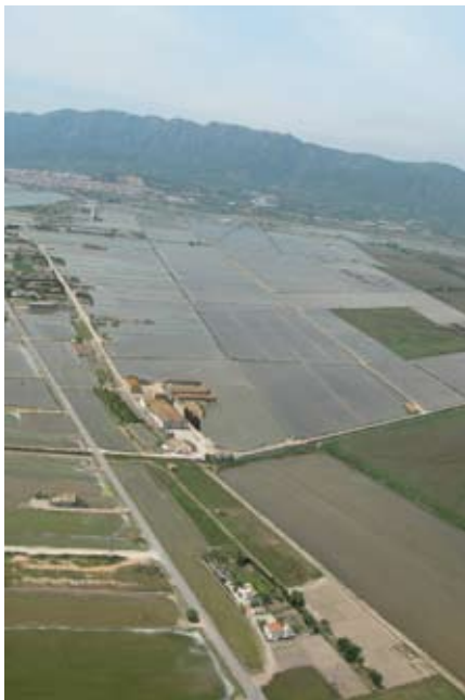
Finca Casablanca, al Delta del Ebre